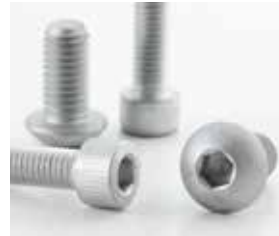
Zinco Lamellare Geomet®