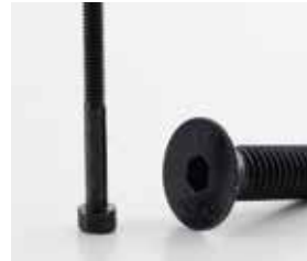
Zincatura Nera Estetica