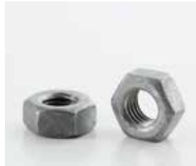
Zincatura a Caldo