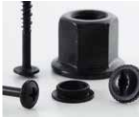
Zinco Nichel Nero