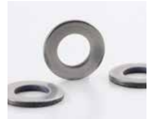
Zinco Nichel Grigio