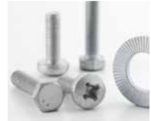
Zinco Lamellare KL100